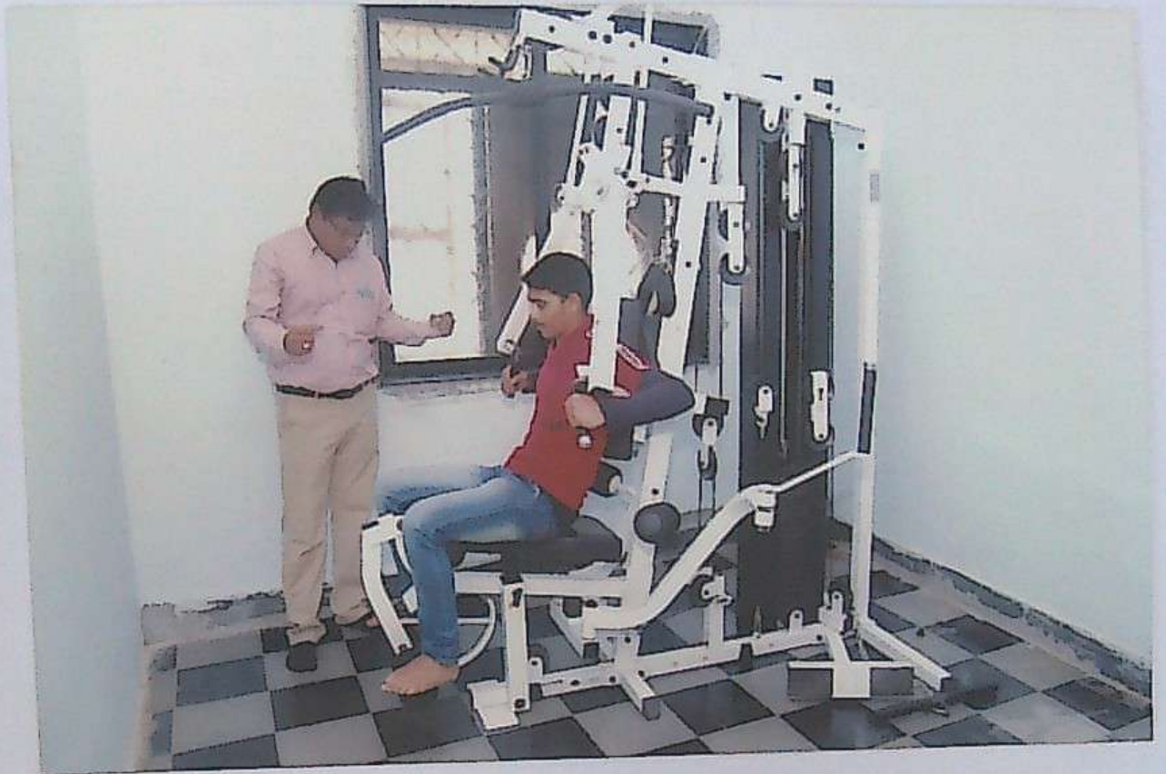
Gyamasicum practices college student (Daily Practices) 2018-2019