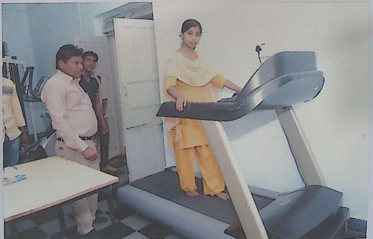
Gyamasicum practices Daily college student 2018 . 2019