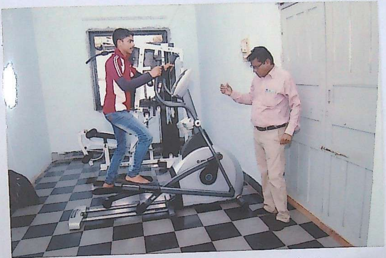
Gyamanasiam Practices" college students 2018 - 2019

Gramin ( Arts, Commerc, & Science ) Mahavidyalaya, Vasantnagar, Tq. Mukhed Dist. Nanded.