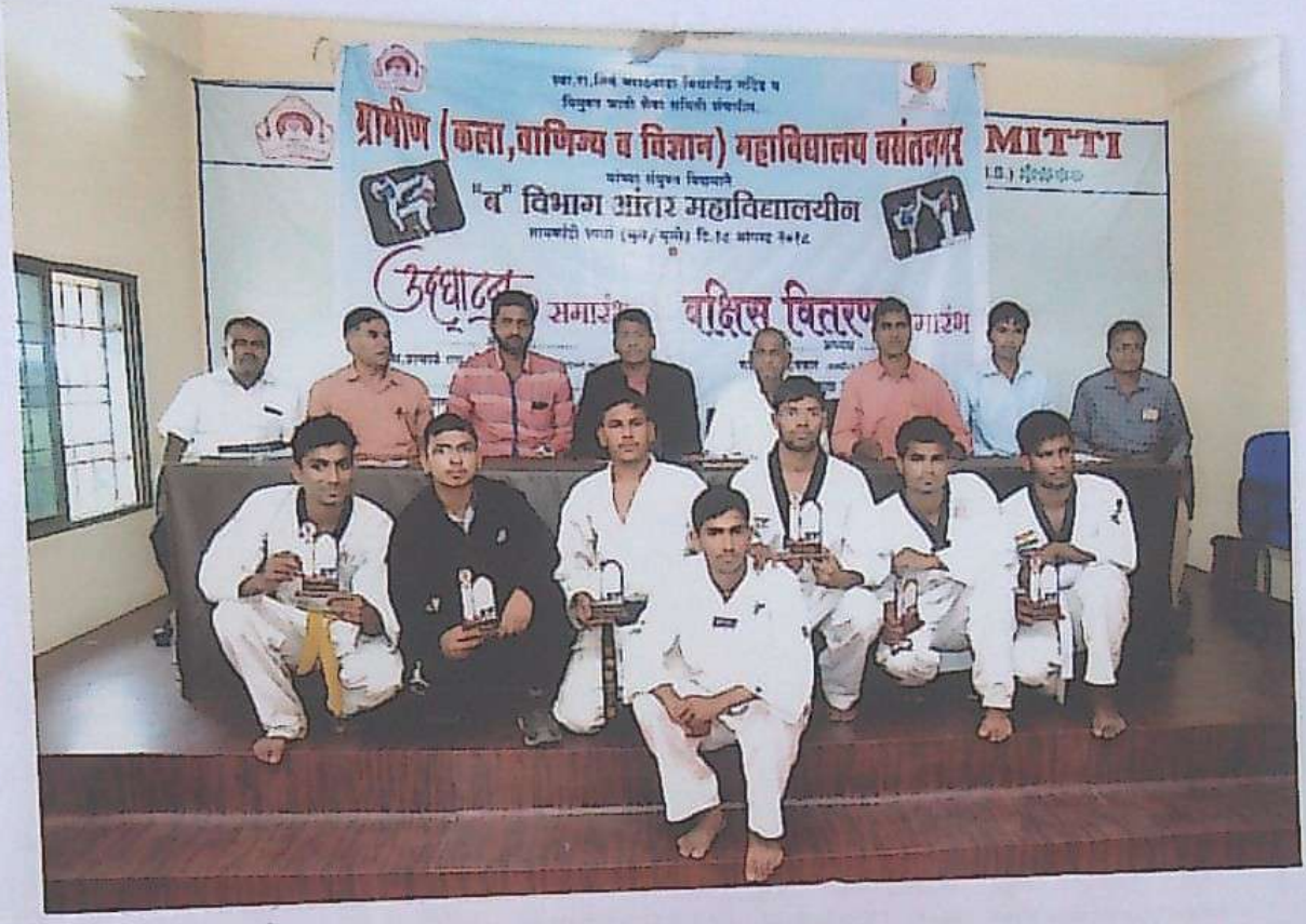
Taekwondo Men and Women competition 2018-19