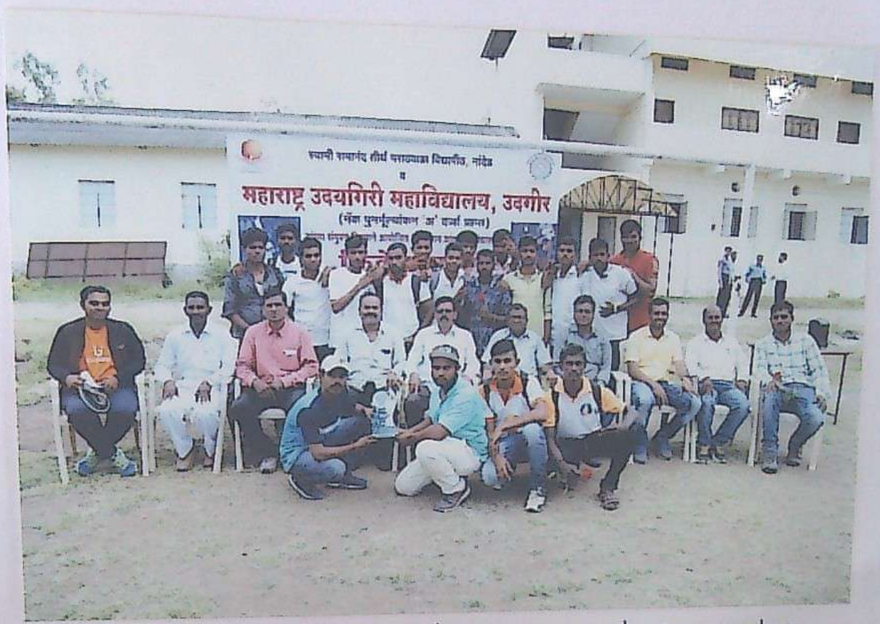
S.R.T.M. University & Vasantnagar Mahavidyalaya Vasantnagar organization " B"zone cricket. RUNNER UP (second place) क्रिकेट स्पर्धेत वरिष्ठ स्तरातला महाविद्यालयाचा संघ

Gramin Mahavidyalaya Vasantnagar " Inter collegiate Tournament " B."zone