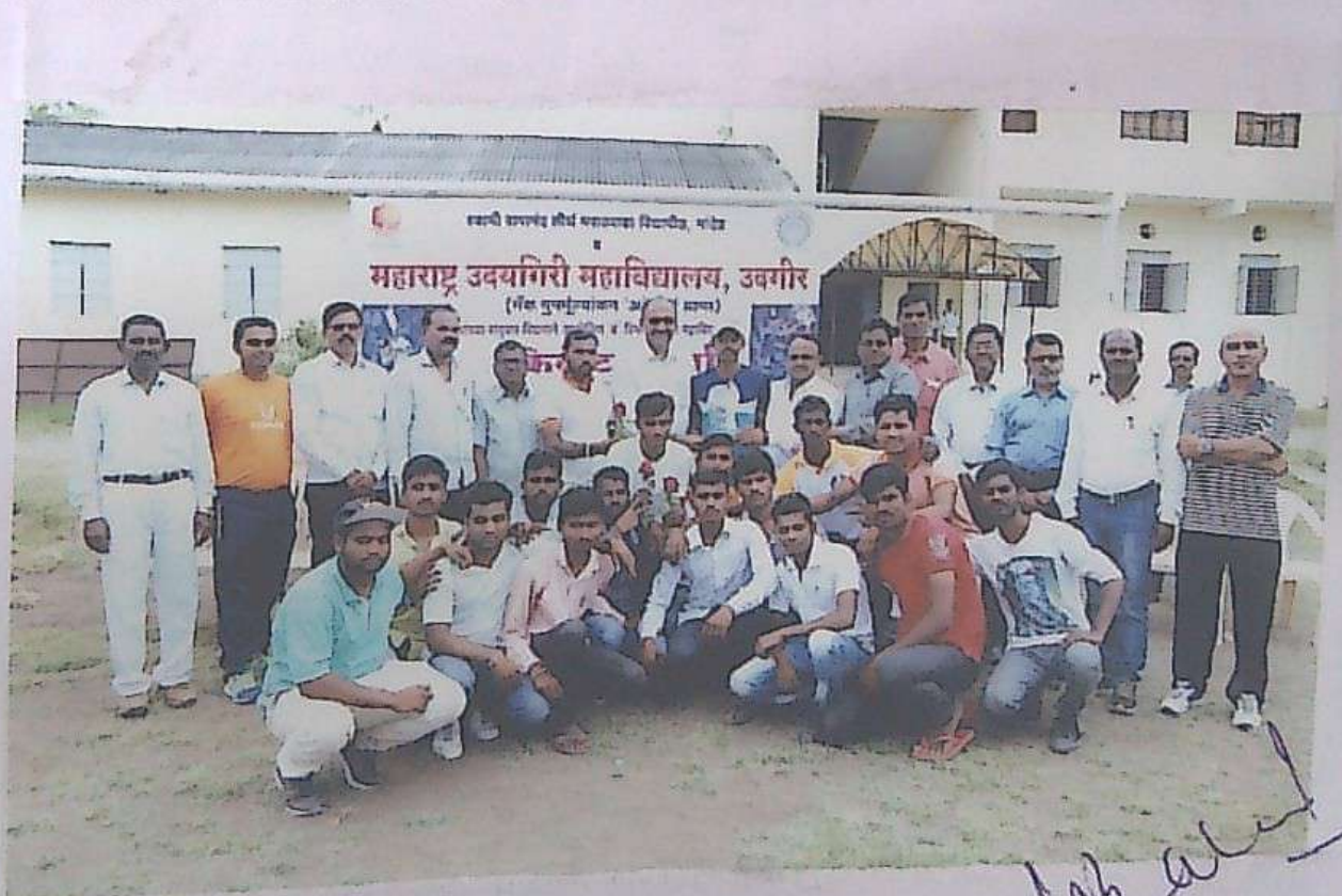
College Cricket team achieved second place II, at M. U. Mahavidyalaya, Udgir : 2018 – 19

W. B. D. PRINCIPAL Gramin (Arts, Comm. & Scienc)er Mahavidyalaya, Vasantnagar (Krag Tq. Mukhed Dist. Nanded (M.S. Na