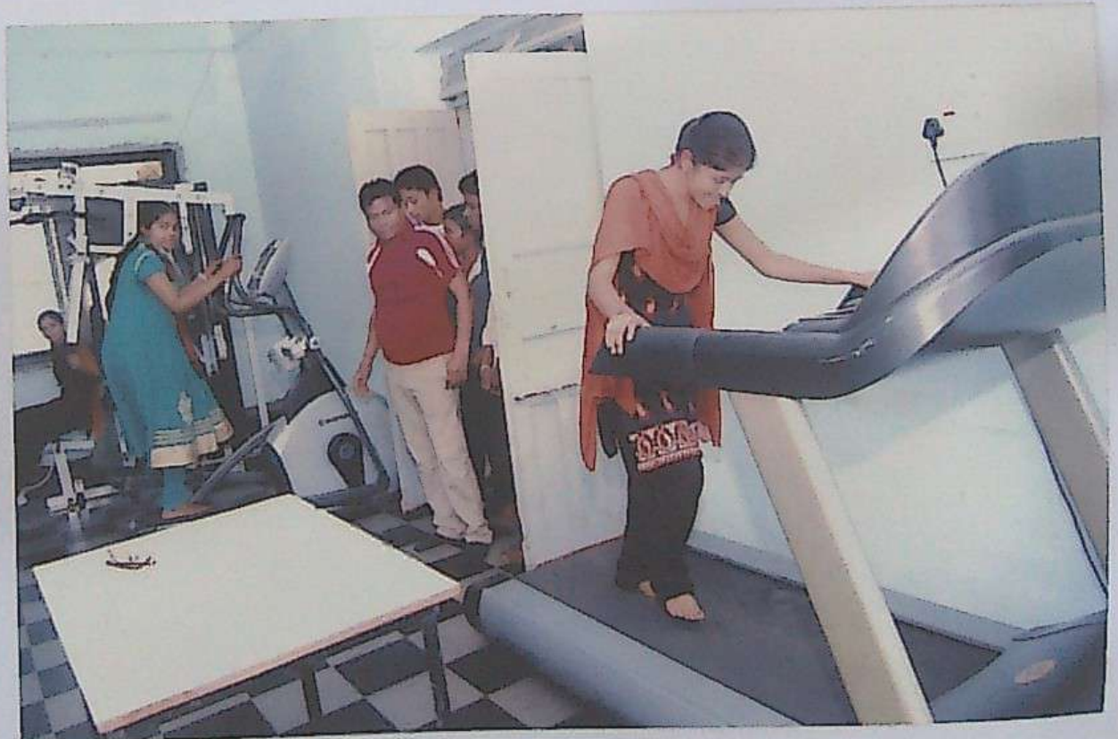
Gyamanasiam Practices" women" my college 2018 - 2019

Principal Gramin Arts, Comm & Sc Mahavidyalaya, Vasantnagar